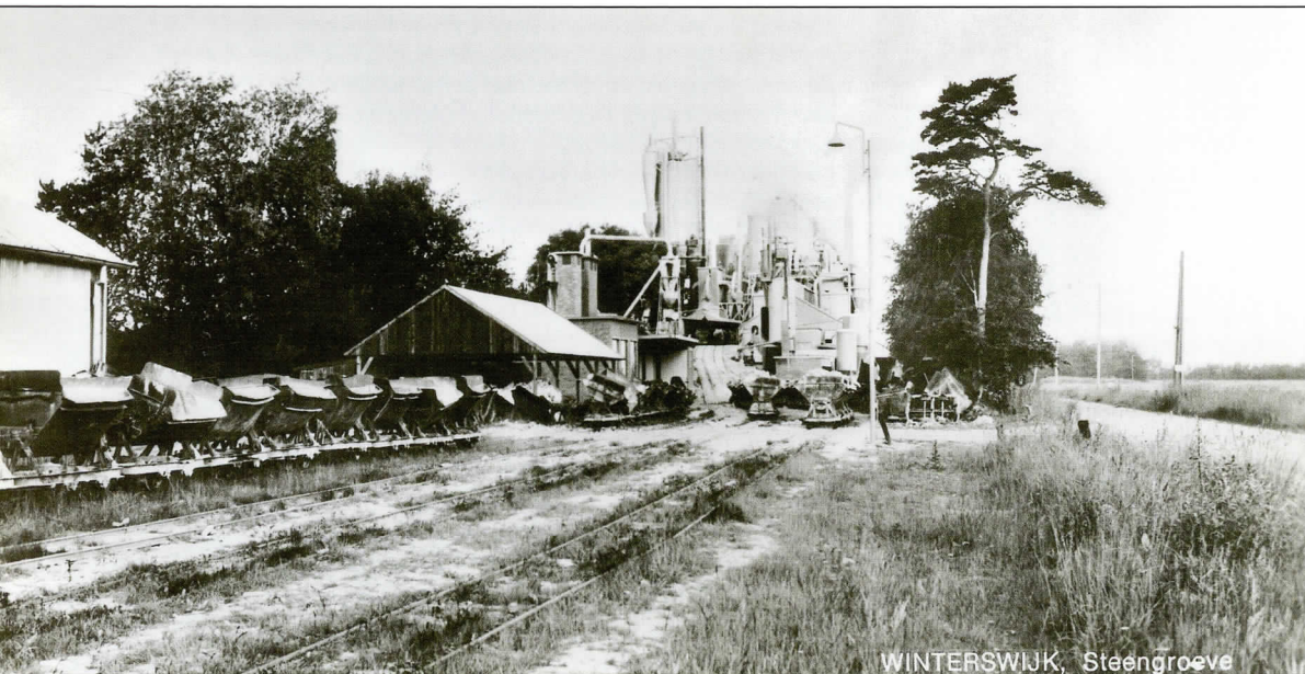
Een tenminste viersporig emplacement, een bijzonderheid in Nederland, circa 1950.

Het smalspoorbedrijf was uiterst overzichtelijk. Er was veldspoor