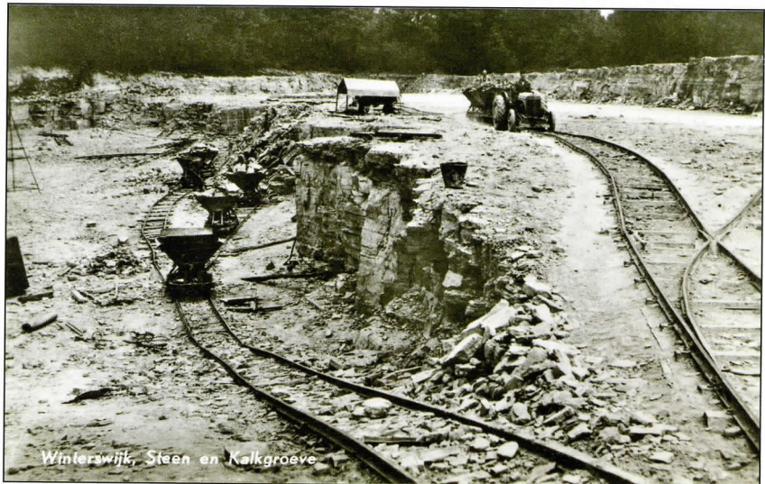
Winterswijk, Steen en Kalkgroeve Rangeren met een Massey Ferguson-tractor, circa 1955.

Hoewel de toeristische aantrekkingskracht van zo'n bedrijf op het eerste gezicht niet heel groot is, zijn er verbluffend veel ansichtkaarten van gemaakt, ik ken er twintig. Het grote gat in de grond bleek voor en kort na de Tweede Wereldoorlog op groepen fietsers een grote aantrekkingskracht uit te oefenen, twee dorpsfotografen hadden het alleenrecht groepsfoto's te mogen maken aan de rand van de groeve. Er wordt anno 2019 nog altijd gewerkt in de groeve en op gezette tijden is deze toneel voor opera- en andere voor-