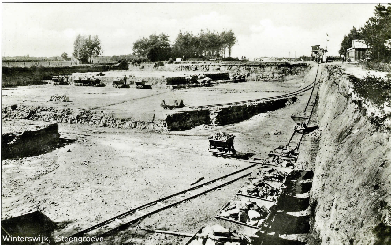
Steengroeve met lierhelling, Winterswijk 1934.

De herinnering aan onze stoomritten op het smalspoor van Steenfabriek De Vlijt in december 2001 liggen bij menigeen nog vers in het geheugen. Een paar honderd meter verderop was ooit nog een steenfabriek die smalspoor in gebruik had. Er is echter nog een Winterswijkse onderneming geweest die langdurig smalspoor gebruikte. Van dat bedrijf zijn onwaarschijnlijk veel ansichten gemaakt waarop het smalspoor vaak de hoofdrol of een tenminste prominente bijrol vervult.