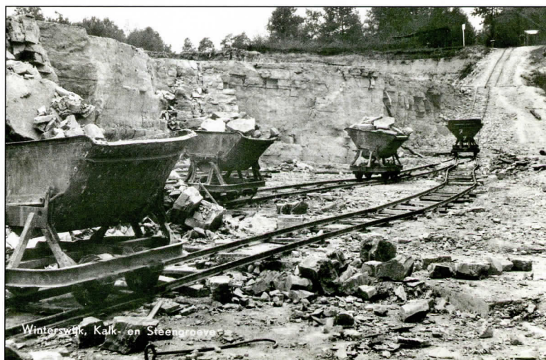
Volle wagens staan gereed om uit de groeve gelierd te worden, rond 1950.

kalkmergel. Dat moest ook wel, want voor wegenbouw bleek de steen toch te zacht. Al met al blijkt in de steengroeve veel perspectief te zitten , schreef De Graafschapsbode op 27 oktober 1933. Daarmee zat men er niet ver naast, want op 23 oktober 1941 werd een kunstmestfabriek geopend als nieuwe loot aan de stam. Ook dat was een initiatief van Hannink. Het Agrarisch Nieuwsblad van 28 oktober 1941 schreef over hem: Met Achterhoekschen durf en ondernemingsgeest heeft deze pionier de zaak aangepakt en 't moet wel een grootsch moment voor dezen rondborstigen en eenvoudigen Achterhoeker zijn, nu vandaag zo'n schitterende zegekroon op zijn levenswerk werd gezet . De onderneming is, na enkele malen in andere handen te zijn overgegaan, tegenwoordig in handen van de Belgische firma Sibelco, dat 175 van dit soort bedrijven in dertig landen exploiteert.