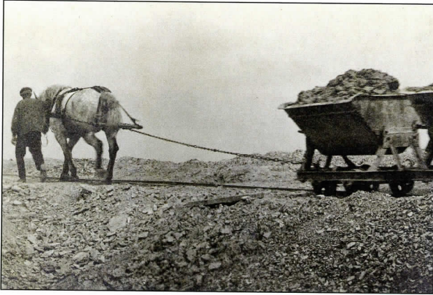
Paardtractie in de groeve, circa 1933.