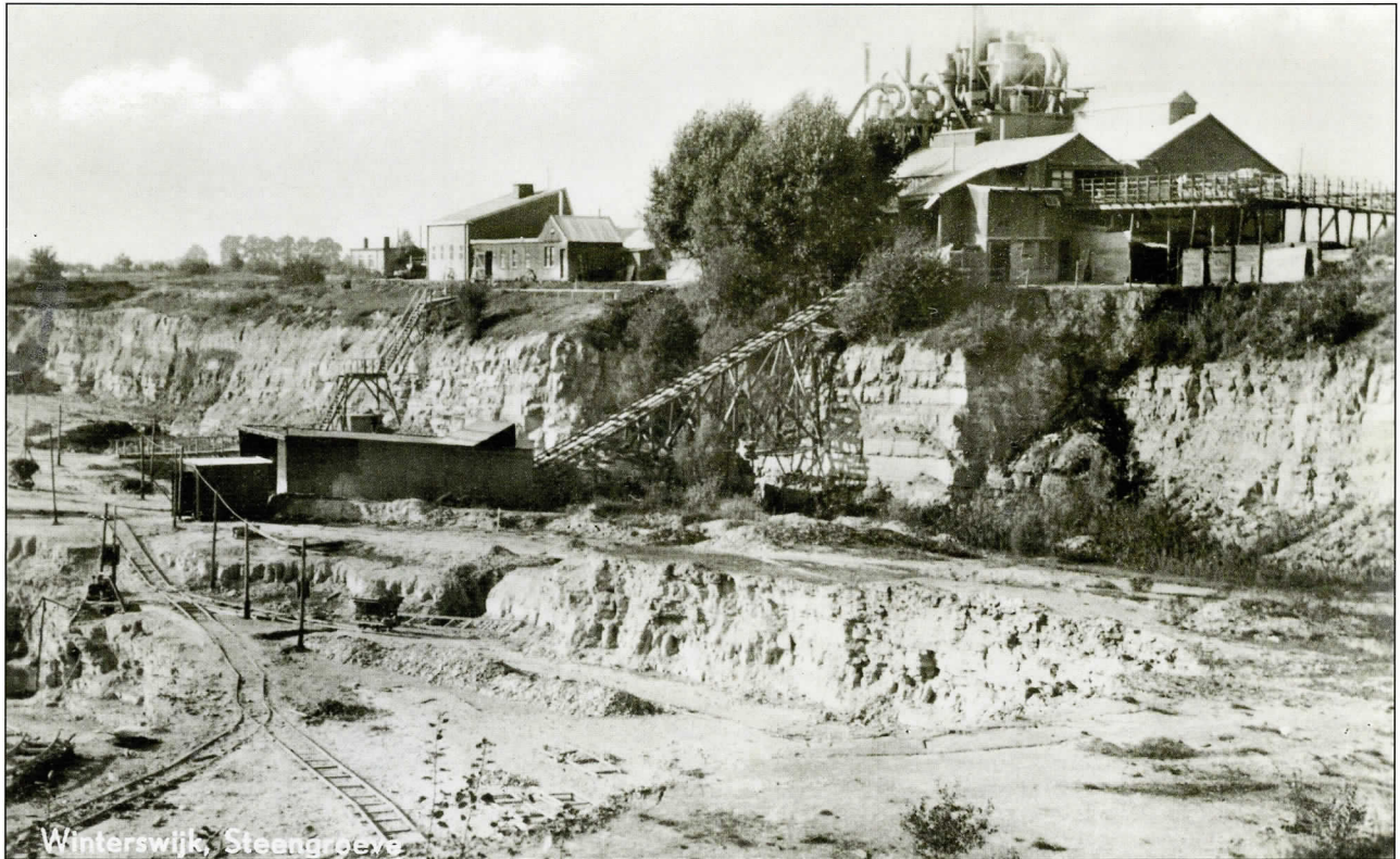
Zowel via een brug (rechts) als via de op dat moment nog niet overdekte dubbelsporige helling werden wagens de fabriek ingelieerd.