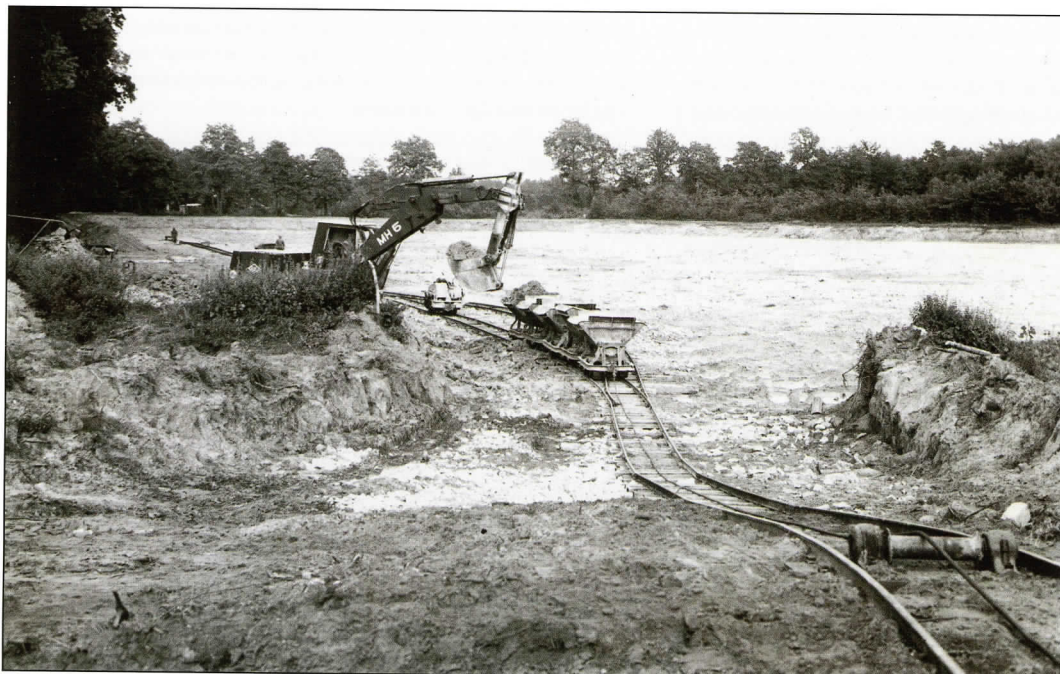
De nieuwe groeve. De zelf gebouwde lorrie die los van de trein staat, was waarschijnlijk te zwak voor de langere afstanden en hellingen, reden de Diema aan te schaffen, circa 1965.

stellingen. Lang werd de groeve met regelmaat geopend voor verzamelaars van fossielen, maar hieraan kwam een einde. De auteur, hartstochtelijk verzamelaar van oude prentbriefkaarten, gaat daarmee voorlopig nog even door.