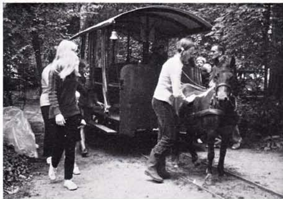
Quicky met rijtuig nummer 1 van JP/TS te 't Joppe; 13 augustus 1972.

Ik zou me kunnen voorstellen dat een rechtgeaard NVBS-er deze informatie over de huidige ponytramexploitatie van de TS wat gebrekkig vindt, en ik meende er dan ook goed aan te doen hieronder een vrije en verkorte weergave te geven van een toneelspel in drie bedrijven, dat onlangs bij het Nieuw Joppes Toneel in première ging.