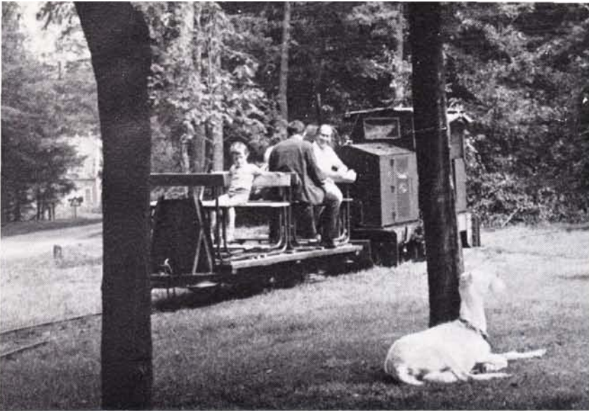
Motortram van JP/TS met lorrie 11 passeert een geit; 't Joppe, 13 augustus 1972. Foto 1163.340 B H. P. Kaper

in beweging. De geit graast onverstoort. Vanaf de Oerweg naderen Klomp en Duparc, de eerste in onberispelijk kostuum, de tweede in een wat overmaats aandoende coltrui. Gnuivend stelt Duparc vast dat naast de gecombineerde initialen van de ponytram 't Joppe (JP) nu ook de letters TS prijken. Als bestuurslid van de Tramweg-Stichting voelt hij zich daardoor op vertrouwd terrein. Later zal blijken dat dit hem aanzet tot haast noodlottige overmoed.