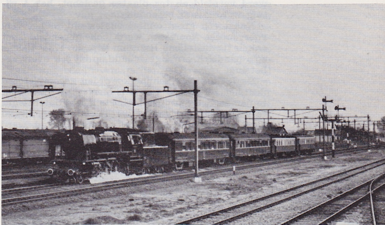
VSM-locomotief 2 (ex DB 023) passeert Elst met extra-trein; 4 november 1976.